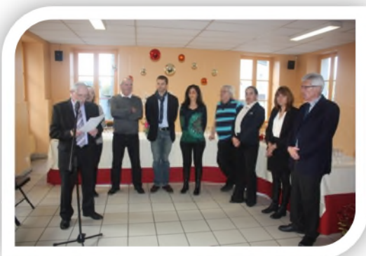
Vœux du Maire

Réservez tous votre DIMANCHE 10 Mai 2015 pour participer à « LA FETE AU VILLAGE »