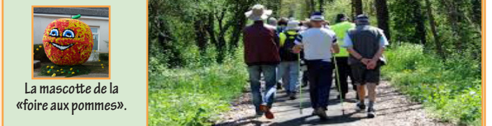
La mascotte de la «foire aux pommes».

Le dimanche était pour les randonneurs à pied, ils se sont alignés sur un parcours d'une douzaine de kms en sous bois, avec de copieux ravitaillements garnis de produits locaux, tout pour rendre des randonneurs et des randonneuses heureux.